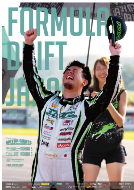
※パンフレットの表紙