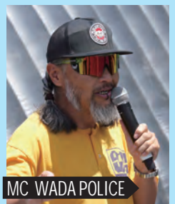
MC WADA POLICE